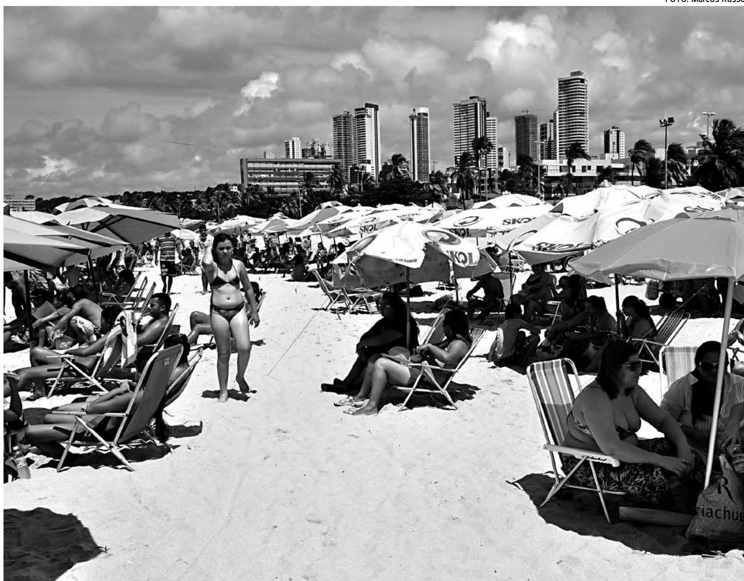
Praia de Tambaú foi um dos espaços mais disputados pelos banhistas nesse feriado de aniversário da cidade de João Pessoa

Aluguel de cadeiras de praia se mostra uma atividade rentável, e equipamentos chegam a render R$ 300 por dia aos seus locadores