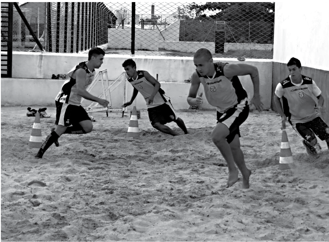
Jogadores do Galo intensificam os treinamentos visando o compromisso contra o Botafogo, sábado