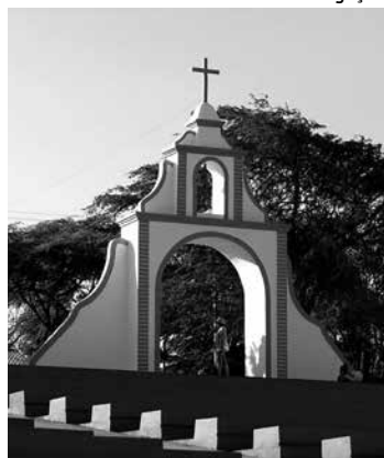
Roteiro fortalece o turismo