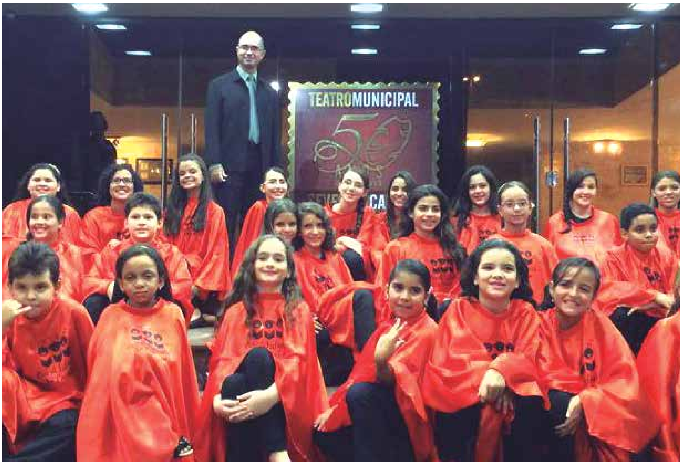
Projeto desenvolvido pela Funesc, juntamente com a Orquestra Sinfônica busca levar a música a diversos espaços do Estado estimulando os jovens para o canto coral