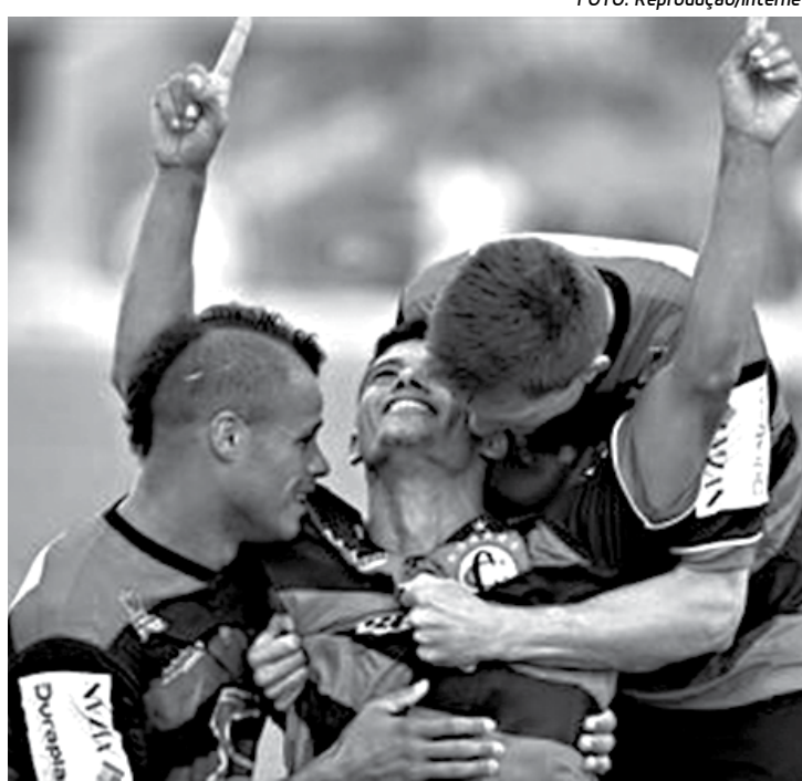
Rubro-negros ainda não venceram no Campeonato da Série D

"Foram poucos treinos até agora com este grupo, e é normal que surja um desentrosamento e isso acaba repercutindo na defesa. Mas eu tenho certeza que neste primeiro jogo, realmente em casa, a coisa será diferente e o Campinense vai conquistar