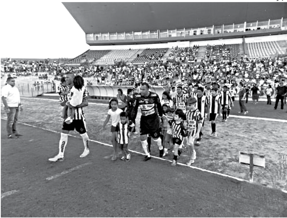
Equipe da capital quer contar com o apoio da sua torcida em mais um Clássico Tradição na Série C

Para o clássico contra o Botafogo, o técnico Givanildo não contará com o zagueiro Pity, que foi expulso e vai cumprir suspensão.