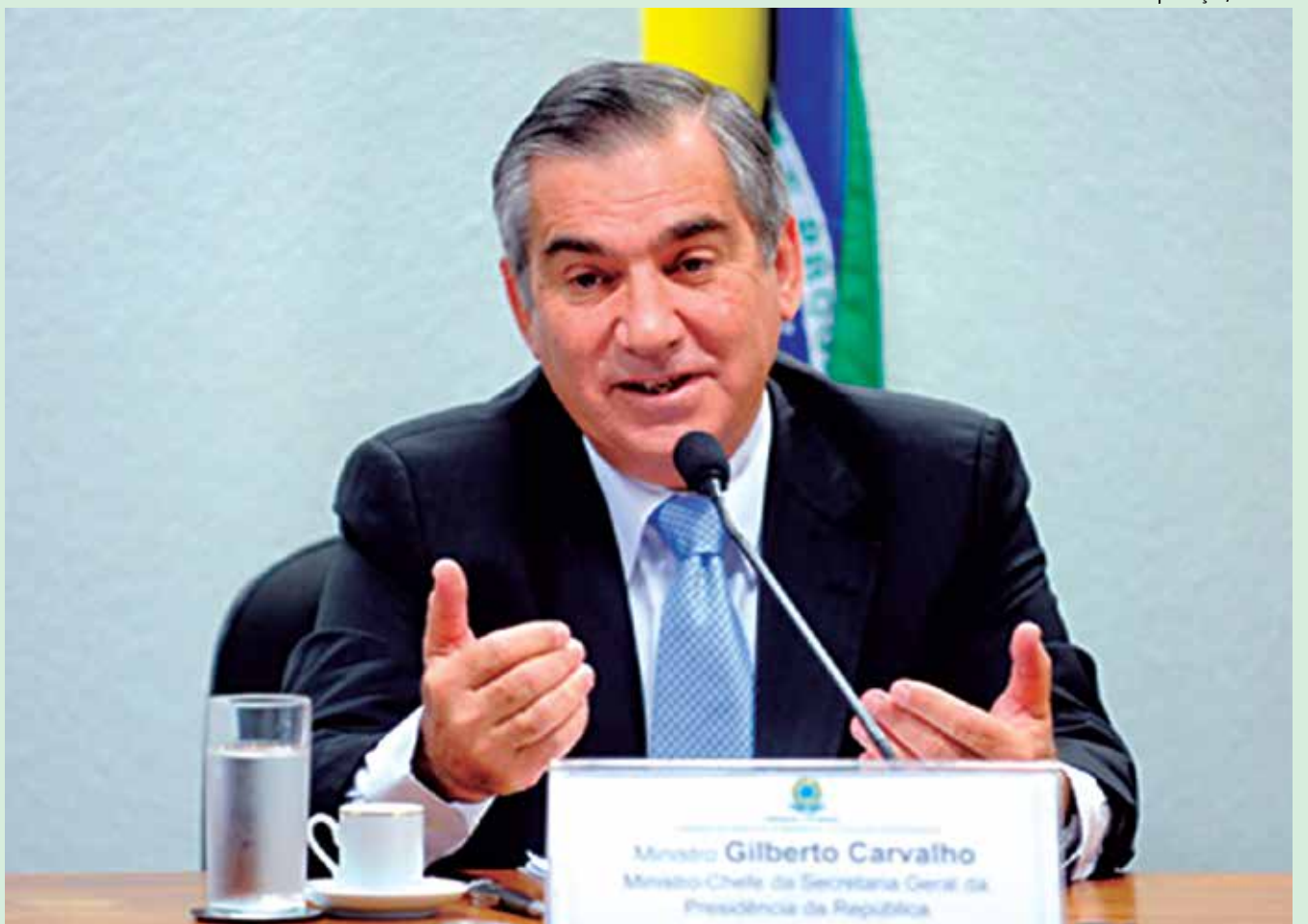
Gilberto Carvalho é ministro chefe da Secretaria-Geral da Presidência da República, e foi um dos debatedores, ontem

A medida, no entanto, foi duramente criticada pela oposição, que a considerou inconstitucional e conflitante com os meios de participação e representação política já existentes. Até mesmo parlamentares da base governista argumentaram que o tema, em vez de ser disciplinado por um ato da Presidência da República (como é o decreto), deveria ser objeto de